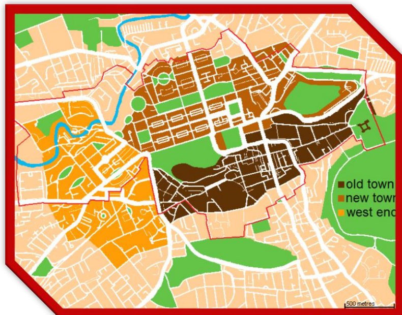
Slika 2. Administrativna podjela

U Edinburghu se nalazi Škotski parlament. Grad je podijeljen na Old Town i New Town. New Town je nastao kao odgovor na prenapučeni Old Town, projektirao ga je u 17.st. arhitekt Robert Adam. Gradom upravlja Unitarno tijelo koje uključuje i 32 lokalna upravna područja koja se rasprostiru na 78 km 2 ruralne okolice.