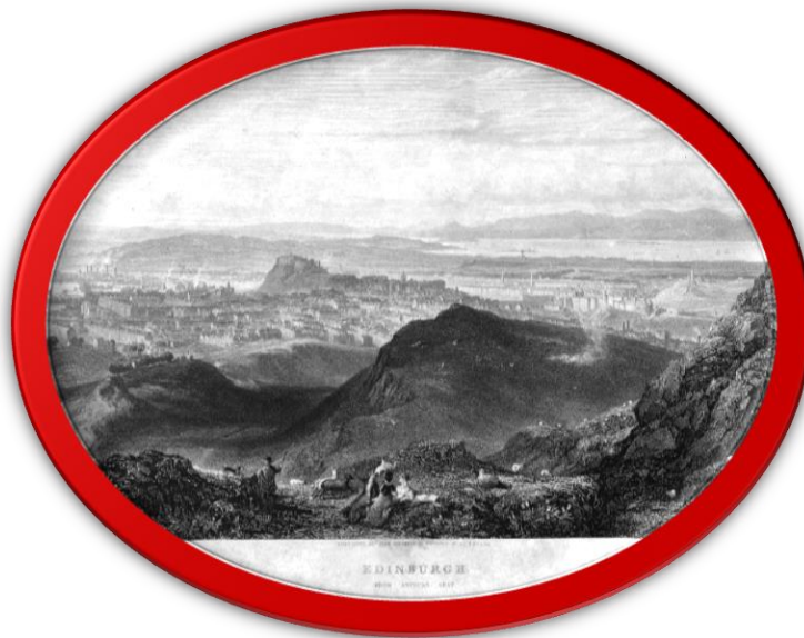
Slika 1. Edinburgh 1826.

Edinburgh je nastao kao utvrda na lako obranljivoj stijeni Castle Rock. Prvi organizirani život se javlja oko 6000 prije Krista u podnožju stijene, u brončanom dobu 1 , tu nastaju prva naselja. Nakon što su Rimljani u 1. stoljeću poslije Krista napredovali u Škotsku došli su u dodir s keltskim plemenom Votadini čija je utvrda Goddodin (Tanka utvrda) već ponosno stajala na stijeni. U 7. stoljeću osvojili su je Englezi iz Northumbrije, uključujući i cijelu južnu Škotsku. Englezi su ga nazvali Eiden Burgh. U 10. stoljeću utvrda je ponovno postala škotska.