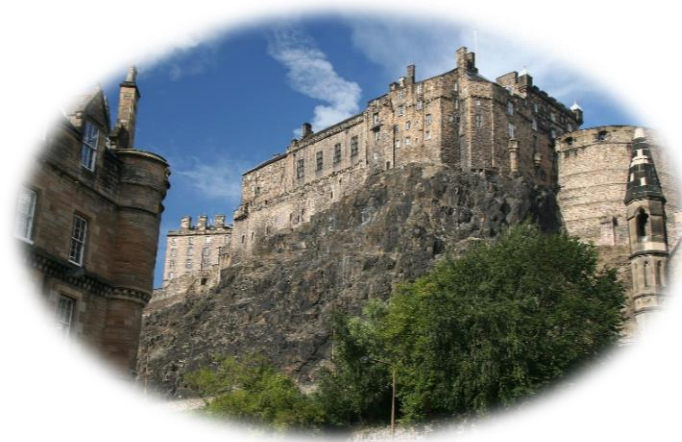
Slika 3. Edinburški dvorac

Novi grad (New Town) je izgrađen u 18. st. kako bi se riješila prenapučenost Starog grada. Dvadesetdvogodišnji James Craig je pobijedio na natječaju 1766. god. sa svojim urbanističkim idejama prosvjetiteljske racionalnosti. Glavna ulica je George Street koja prati prirodni hrbat Starog grda, a uz nju se pružaju ulice Princess Street i Queen Street ispunjene neoklasicističkim građevinama. Robert Adam je uredio trg Charlotte koji se smatra vrhuncem ovog stila, a na njemu se nalazi prva rezidencija škotskog premijera, Bute House. Sredinom 19. st. u ovoj četvrti je izgrađena Škotska nacionalna galerija i Kraljevska škotska akademija iznad nasipa negdašnjeg močvarnog kanala.