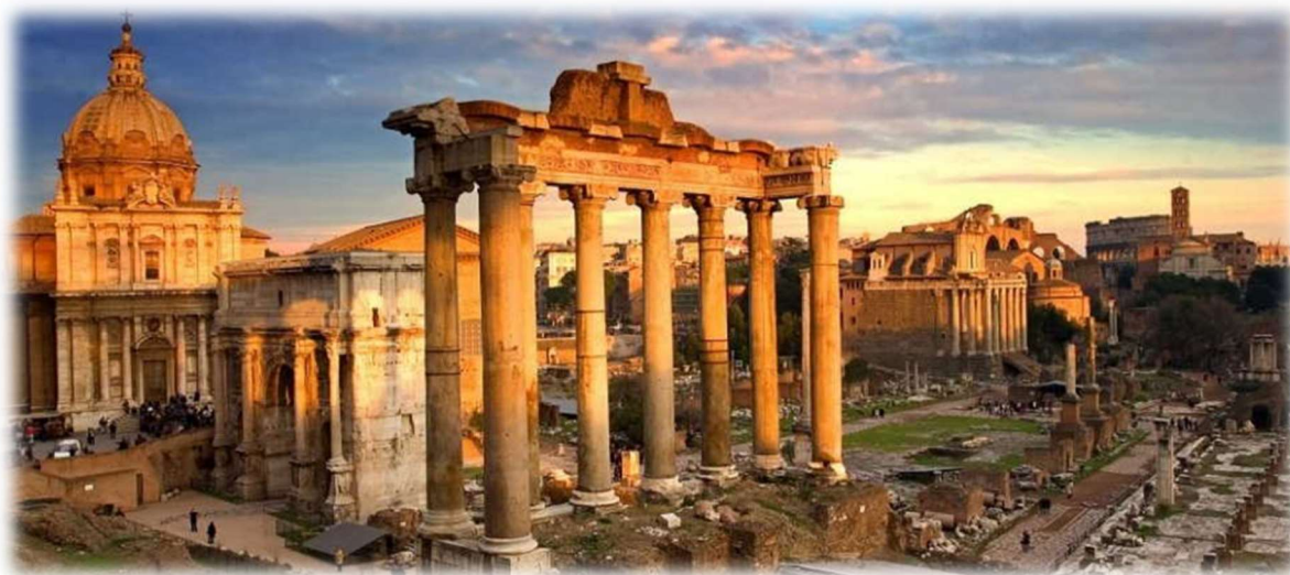
Slika 1. Rimski Forum

Razdoblje postanka i ranog doba rimske republike označava vrijeme osnivanja i osiguranja rimske države. 496. pr. Kr. Rimljani pobjeđuju Latine u bitci kod Regilskog jezera a 493. pr. Kr. stvaraju i ulaze u savez s federacijom latinskih gradova. U ovom razdoblju se i javljaju i prvi sukobi između plebejaca i patricija (prvi secessio plebis), gdje plebejci, zbog svog teškog položaja u gradu koji je pod vlašću patricija, odlučuju napustiti grad Rim i osnovati drugo naselje. Polovinom 5 stoljeća pr. Kr. Decemvir objavljuje tablicu dvanaest zakona, čime se određuju prava rimskih građana.